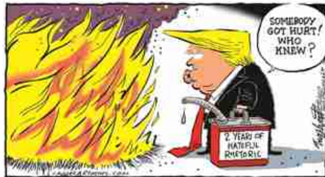
2. Bob Englehart

In queste due vignette, la prima di un artista italiano (Vignette ru), la seconda di un artista americano (Bob Englehart), la rappresentazione del presidente americano Trump, ritratto in due situazioni differenti, è in realtà molto simile poiché entrambi gli artisti hanno utilizzato quelli che sono gli elementi caratteristici di questo “personaggio”: