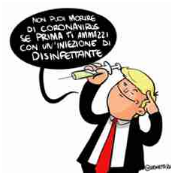
1. Vignette ru